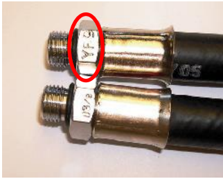
バッチコード印字箇所(写真1)

オリフィス（プラスチック製 流量調整部品）を取り外してご使用ください。 本対象の給気ホースを付けたままでダイビングをしないでください。 当該ホースを接続された（または接続したことがある）ダイビング器材を使用しないでください。知識のある方がオリフィスを取り外してください。