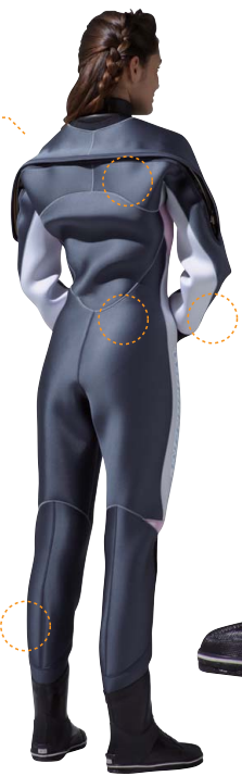
ネオグレイ/ホワイト/ビーチ/シルバーステッチ/ブルー-ピンクラメマーク